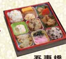
吾妻橋 あずまばし