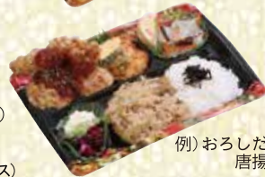
(例)おろしだれ唐揚げ