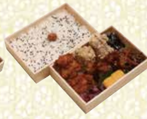
特製唐揚二段弁当 216mm×120mm 1,350円(税込)