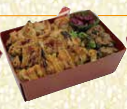
焼きとり重 やきとりじゅう