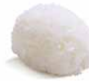
塩おにぎり・白飯