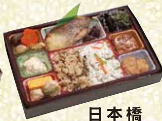
日本橋 にほんばし