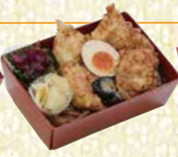
鶏天重 とりてんじゅう