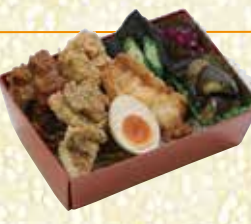
五宝唐揚げ重 ごほうからあげじゅう