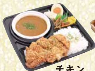
チキンカツカレー 225mm×225mm 1,300円(税込)