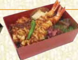
えび天重 えびてんじゅう