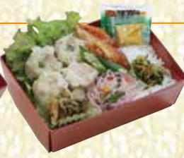
焼売重 しゅうまいじゅう