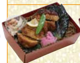
鶏照重 とりてりじゅう