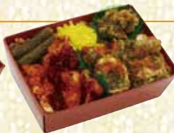
鬼弁赤青 ハーフ&ハーフ