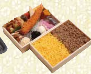
鶏そぼろ二段弁当 216mm×120mm 1,350円(税込)