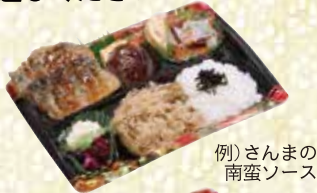
(例)さんまの南蛮ソース